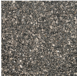
Voegsplit Granit Grey 2-4 mm 25 kg