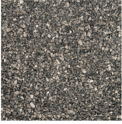
Voegsplit Granit Grey 2-4 mm 25 kg