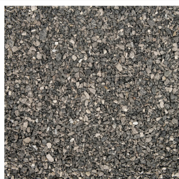
Voegsplit Granit Grey 2-4 mm 25 kg