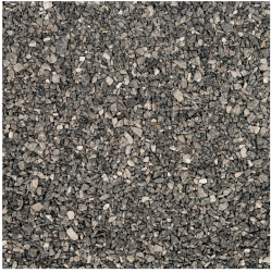
Voegsplit Granit Grey 2-4 mm 25 kg